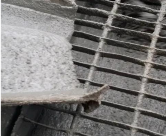
自密实混凝土入泵状态

近日，住建部组织编制的最新也是该领域首部国家标准《新拌自密实混凝土性能试验方法》完成征求意见稿，目前该标准已完成意见反馈，正式发布后将极大推动这项 无需振捣自密实的混凝土施工新技术 的发展与应用。