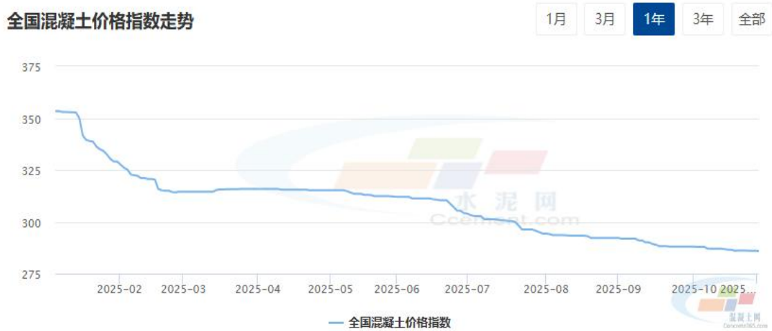
图1：10月全国混凝土价格指数走势运行情况

截至10月底，全国混凝土价格指数（CONCPI）报收91.04点，较9月底下跌0.7%，与去年同期相比，价格跌幅为19.31%。