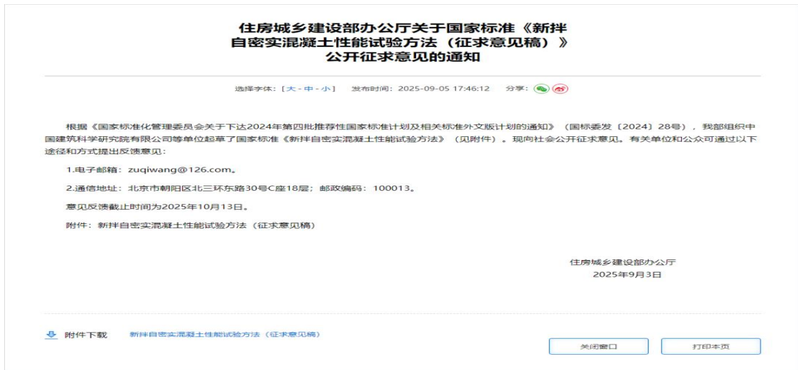
住建部官网通知截图

因此，首部国家标准《新拌自密实混凝土性能试验方法》应运而生，规定了新拌自密实混凝土性能的试验方法，包括扩展度和扩展时间试验、V形漏斗试验、L形箱试验、筛分离析试验、J形环试验和U形箱试验。