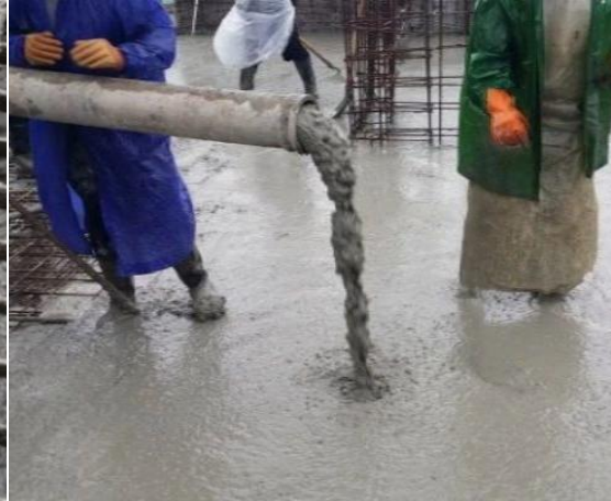
自密实混凝土出泵状态

自密实混凝土，具有高流动性和稳定性，浇筑过程中不离析、不泌水，仅在自重作用下流动即可填充模板并包裹钢筋，无需振捣自密实，绿色施工完成高质量高效率的混凝土浇筑，尤其适用于工期紧、浇筑量大、钢筋密集、施工难度大的工程，将被大力推广应用。