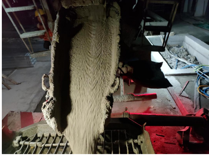
贵阳九悦综合体项目C30自密实混凝土

大批工程项目应用反馈，自密实混凝土能够解决传统混凝土振捣密实难题，满足工程建设对高质量高强度混凝土的需求。